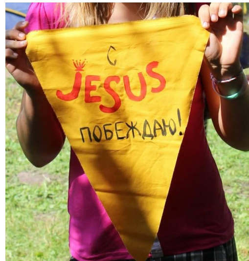
Рисунок – Примеры вымпелов