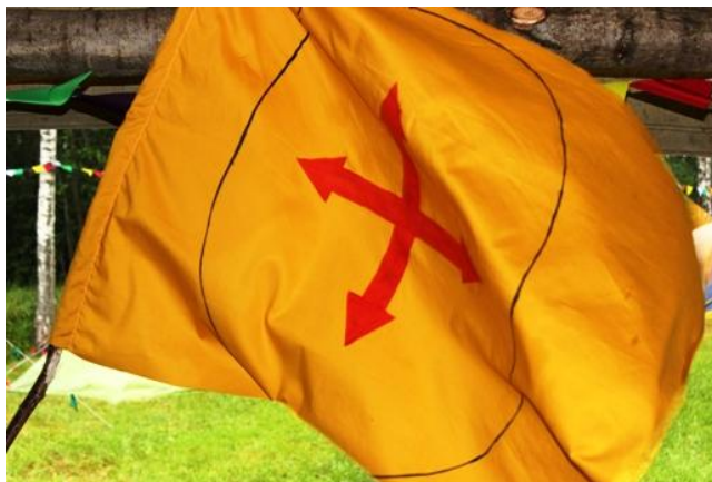
Рисунок – Пример знамени баннеретов

2 к 3 (горизонтальной или вертикальной ориентации) определенного геральдического цвета. Каждый цвет в геральдике имеет определенное значение, поэтому подберите для каждого баннерета цвет, наиболее характеризующий его. Если в отряде два баннерета, цвет должен характеризовать их обоих. На знамени необходимо предварительно нарисовать геральдический щит и крест (как символ участия в крестовом походе).