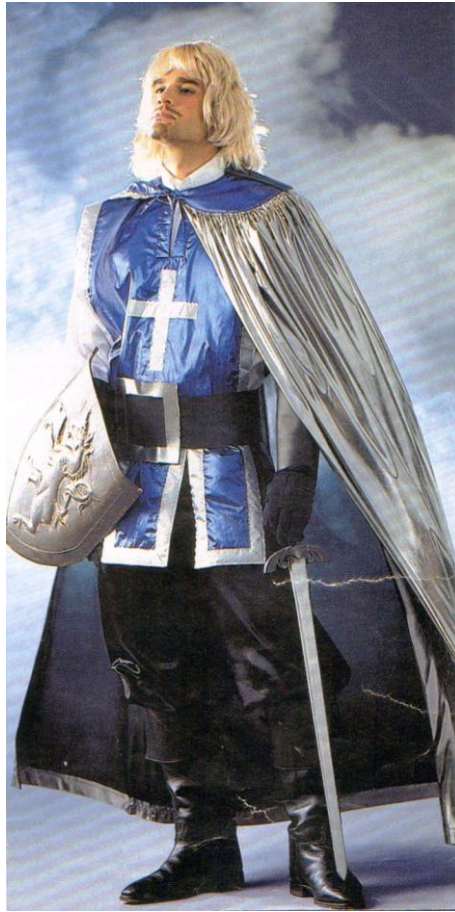
Рисунок – Рыцарский костюм