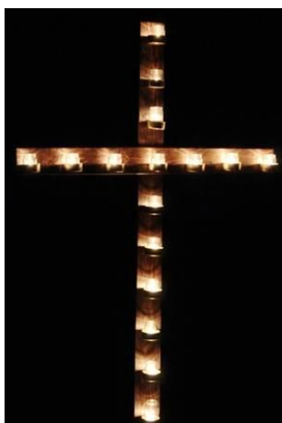
Рисунок – Деревянный крест

Важным элементом украшения территории является деревянный крест – символ присутствия и близости к нам Нашего Предводителя, символ Его поддержки во время нашей войны с грехом. На ночь устанавливайте его посреди жилой площадки и зажигайте на нем свечи. Этот крест является обязательным атрибутом украшения походной часовни. Повесьте на него терновый венок, заменив его в последний вечер короной.