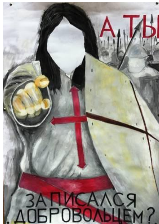
Рисунок – Советский и «рыцарский» плакаты

Вариант: лицо рыцаря можно будет вырезать, и каждый желающий сможет сфотографироваться и стать «лицом» агитационной кампании.