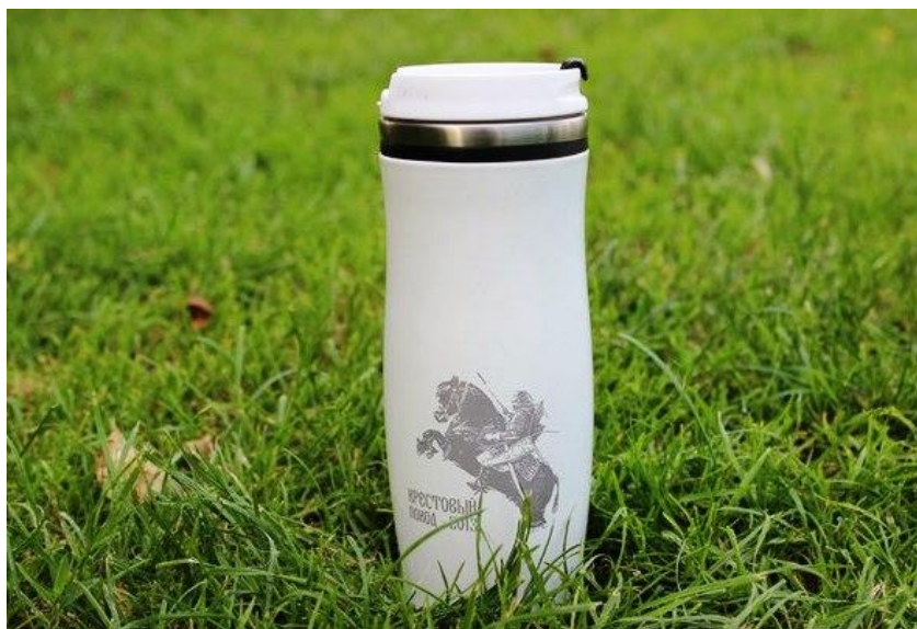
Рисунок – Термокружка

Приготовьте несколько ценных памятных сувениров с лагерной символикой, например, термокружку (макет – см. диск).