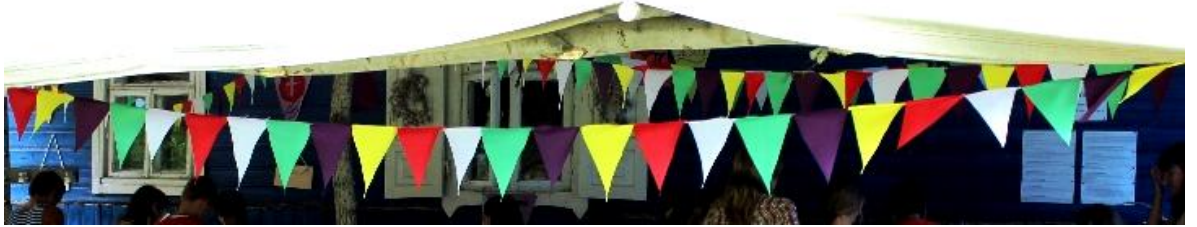
Рисунок – Флажки

Украсьте ими трапезную, походную часовню, другие часто посещаемые объекты.