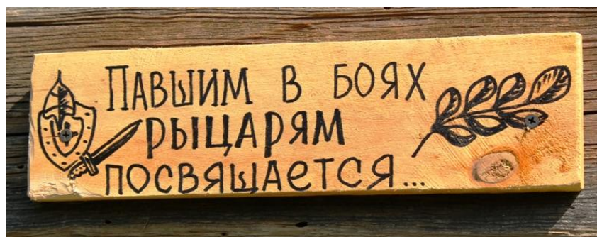
Рисунок – Мемориальная табличка

Рекомендации по оформлению памятника: это должно быть сухое, лишенное ветвей, обожженное дерево. Рядом с ним повесьте мемориальную табличку с указанием имен тех, кому посвящается этот памятник, в конце оставьте свободное место. Это должны быть имена реальных рыцарей, которые так и не достигли победы, например, Вальтер Голяк (один из предводителей крестьянского похода).