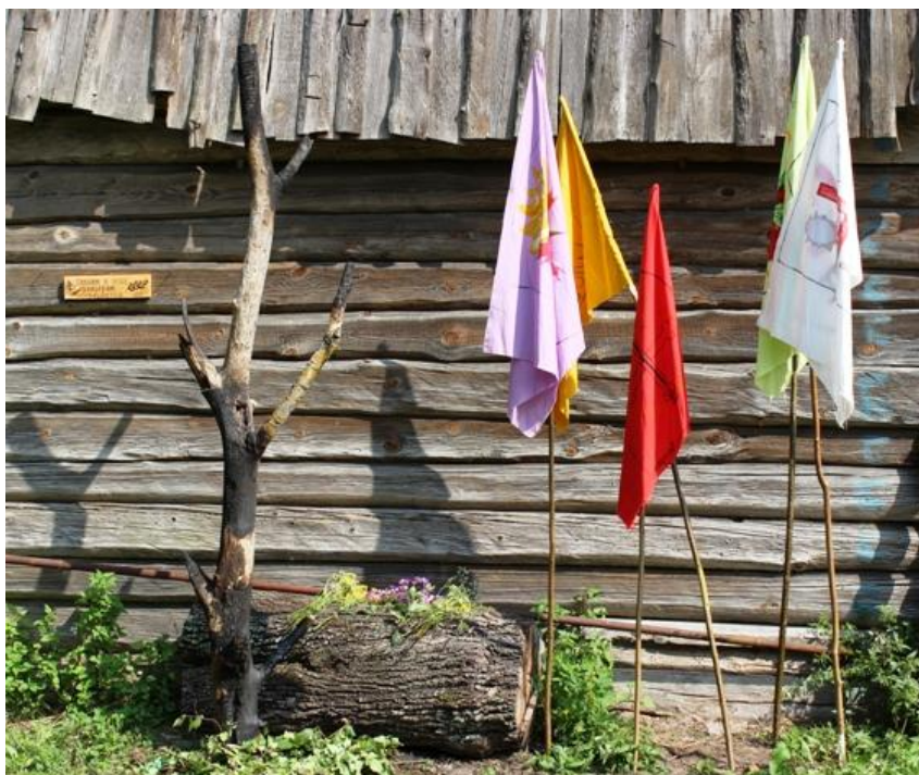
Рисунок – Памятник

Устройте торжественное под звуки траурного марша шествие к месту церемонии. Возложите у подножия памятника цветы, венки. Пусть знаменосец каждого отряда установит рядом с памятником свое знамя, отдавая тем самым дань храбрости погибшим рыцарям