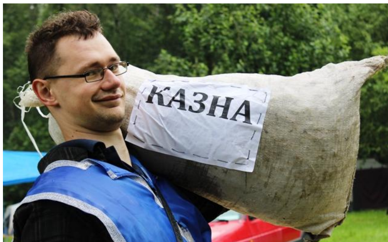
Рисунок – Казначейство

Этап 3 «Казначейство». Подростков встречает казначей крестового похода. Инвентарь: большой мешок, набитый доверху, с большой надписью «Казна». Здесь они отдают взносы участника и получают взамен лагерные деньги, другими словами, меняют валюту.