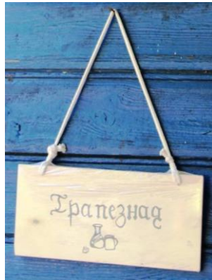
Рисунок – Пример таблички

Обозначьте стратегически важные объекты соответствующими табличками.