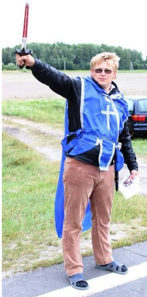
Рисунок – Рыцарь-страж

Этап 1 «Рыцарь-страж». Первой ступенькой к погружению в атмосферу «Крестового похода» является рыцарь-страж. Он встречает приезжающих при съезде в сторону лагеря (или где-то поодаль от лагеря). Его атрибут: меч.