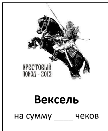
Рисунок – Пример векселя

За соответствующее нарушение устава налагается штраф. Его величина зависит от значимости проступка и колеблется от 1 до 5 чеков. Взимать штраф может любой сотрудник, наложивший его. В случае, если у подростка на данный момент нет денег, казначей помечает в своем блокноте размер долга и по истечении некоторого времени должен истребовать его.