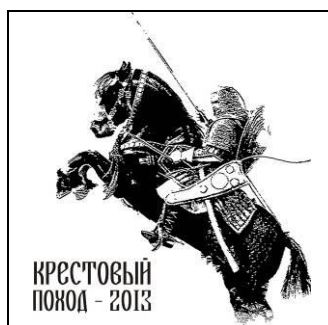
Рисунок – Пример чека

В «Крестовом походе» действует денежная система мотивации. Каждый рыцарь в начале программы в обмен на взнос участника получает стартовый капитал в размере, например, 5 чеков. В течение всего «Крестового похода» можно зарабатывать дополнительные чеки и тратить их на ярмарке или на различные развлечения и удовольствия. Вариант: чеки могут получать и сотрудники. Это будет стимулировать их быть пунктуальными и быть примером для своих воспитанников.