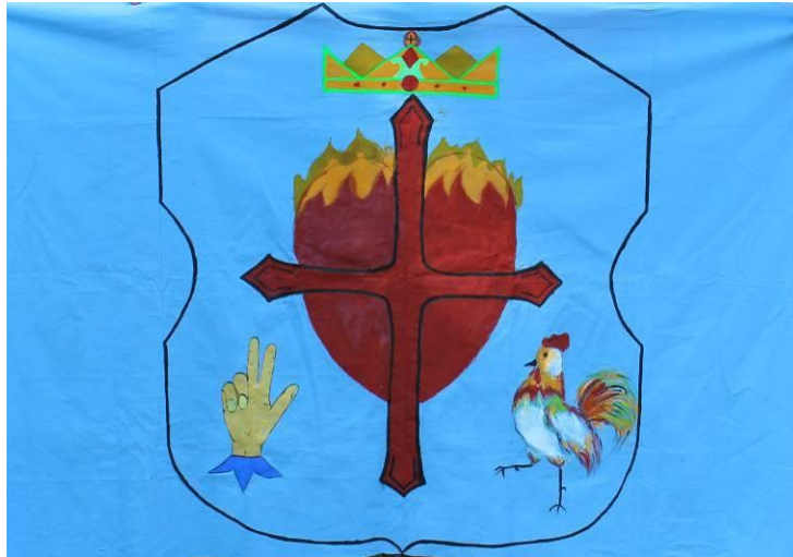
Рисунок – Знамя

Размер знамени должен быть больше отрядных знамен. Соотношение сторон 2 к 3.