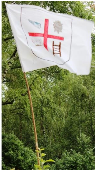
Рисунок – Отрядное знамя