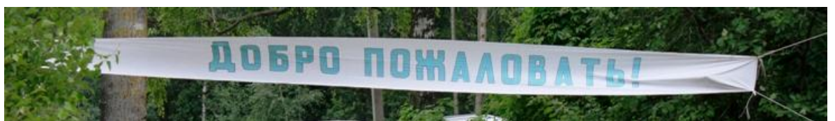
Рисунок – Растяжка

а. Растяжка над входом на территорию лагеря