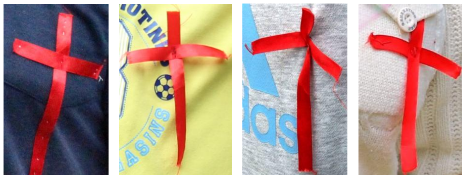
Рисунок – Символ участия в походе

Крест является символом Крестового похода – и войны за освобождение Святой земли, и нашей войны против греха. Поэтому все участники войны нашивали себе на одежду в области груди крест из красной материи, а, вернувшись из похода, нашивали его на спину между лопаток. Это был своеобразный дресс-код. Все участники «Крестового похода» также обязаны носить на себе красный крест. Никто не имеет права на территории лагеря появляться без него. Если меняется одежда, необходимо перешивать и крест. Его нужно именно пришивать, а не прикалывать булавками или крепить каким-либо другим образом. А в конце похода устройте конкурс на самое быстрое пришивание креста.