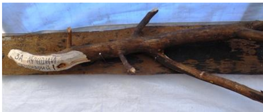
Рисунок – Пример награды («За лучший сценарий»)