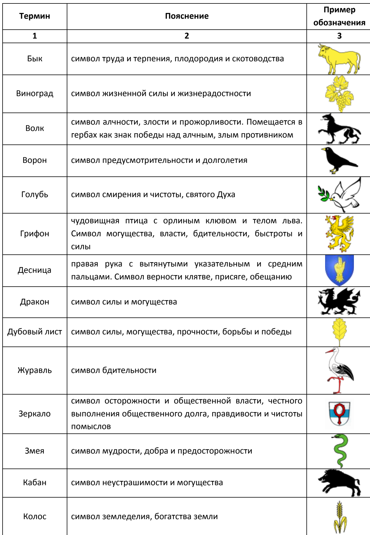
Таблица – Геральдические символы и их значения